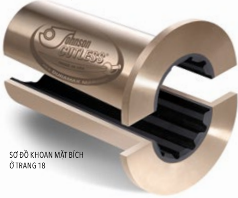
SƠ ĐỒ KHOAN MẶT BÍCH Ở TRANG 18

Các Ổ Bích Johnson Cutless® được đúc lý tâm bằng đồng thau hải quân, với mặt bích tích hợp sẵn bắt bu lông vào ống đuôi tàu hoặc vỏ bọc thanh chống nhằm giữ chặt ổ đỡ và tránh tự quay trong hộp. Lớp cao su lưu hóa chống dầu và hóa chất với công thức đặc biệt được gắn chặt vào lớp vỏ.