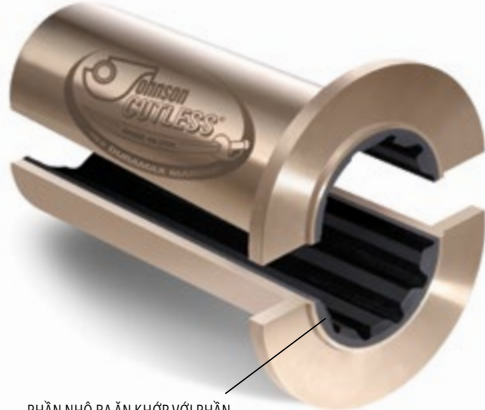
PHẦN NHỎ RA ẮN KHỚP VỚI PHẦN LỖM VÀO CỦA HỘP ÉP KÍN

Được sản xuất với cùng chất lượng chế tạo giống như các Ổ Đờ Đồng Thau Hải Quân khác của Johnson Cutless® các Ổ Bích dùng cho việc lắp đặt Ống Đuôi Tàu Chuyển Tiếp có phần nhô ra được thiết kế ăn khớp với phần hõm vào trên mặt bích của Hộp Ép Kín. Hộp Ép Kín có cửa dẫn nước vào để bôi trơn ổ đỡ.